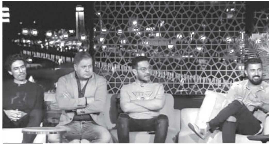
فريق مسلسل البرنس

تحدث عن دوره فى مسلسل «١٠٠ وش» و«البرنس»، كما استضاف البرنامج الفنان محمد مهران وتحدثت عن دوره فى مسلسل «البرنس». والذى يقدمه كل من المذيعة لبنى عسل وحسام حداد، على قناة الحياة، استضاف أسرة مسلسل «الفتوة» من الفنان ياسر جلال، احمد صلاح حسنى، والفنانة مى عمر، ونجلاء بدر. كما استضاف أسرة عمل «عمر ودياب» من الفنان على