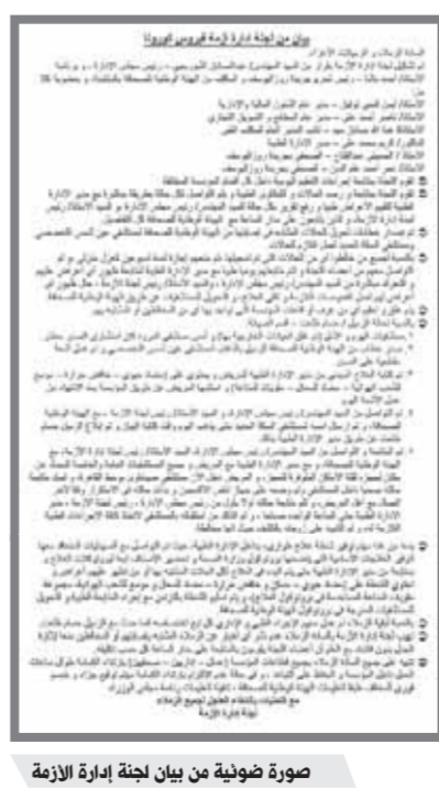
صورة ضوئية من بيان لجنة إدارة الأزمة

لجميع العاملين بشركاتها وهيئاتها التابعة والالتزام بالمسئولية الاجتماعية تجاه ابنائها، وبناءً على توجيهات الطيار محمد منار، وزير الطيران المدني، بتوفير سبل الرعاية الطبية والتدابير الاحترازية للحفاظ على صحة وسلامة العاملين بقطاع الطيران، خاصة في ظل انتشار فيروس كورونا المستجد، تم توقيع بروتوكول بين مستشفى مصر للطيران واحد المستشفيات الخاصة بمنطقة الماطة بمصر الجديدة لتخصيص مبنى المستشفى بالكامل لتقديم الخدمة الطبية للعاملين بحقل الطيران المدني؛ لتلقى العلاج أو العزل في حال تعرض أحدهم للإصابة بفيروس كورونا واستخدام المستشفى بكامل إمكانياتها وأجهزتها ومعداتها الطبية لعلاج العاملين، وذلك تحت إدارة وإشراف شركة مصر للطيران للخدمات الطبية.