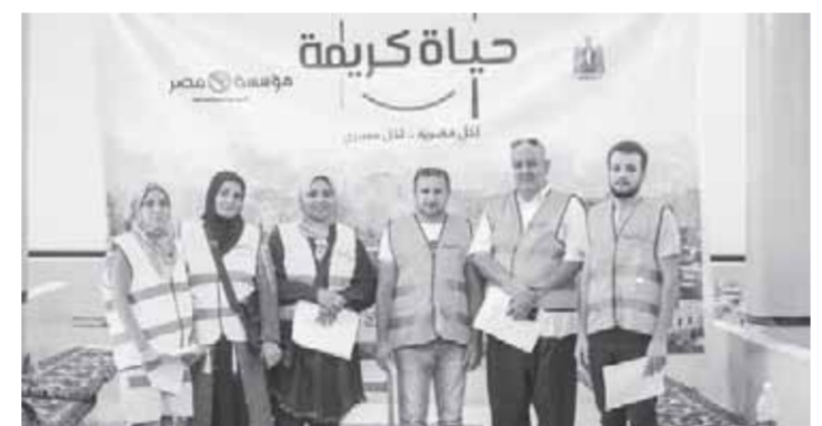
بالرعاية داخل القرى المستهدفة. ويستفيد من المبادرة حتى يونيو 2021 3,2 مليون مواطن يمثلون حوالي 800 أسوة مع معظم في صعيد مصر (7 محافظات) وهي (أسيوط، سوهاج، قنا، أسوان، المنيا، الأقصر، الوادي الجديد)

إضافة إلى 4 محافظات بالوجه البحري والحدود وهي (مطروح، البحيرة، الدقهلية، القليوبية). وتم تنفيذ خلال المرحلة الأولى للمبادرة استثمارات 3,5 مليار جنيه حتى 30 ديسمبر 2020 منها 1,9 مليار جنيه استثمارات إضافية تدار من خلال وزارة التنمية المحلية، 288 مليون جنيه مساهمة برنامج التنمية المحلية بصعيد مصر في قنا وسوهاج، 568 مليون جنيه استثمارات مدرجة بخطط المحافظات والهيئات المركزية المختلفة في العام المالي 2019/2020، 582 مليون جنيه استثمارات من خلال وزارة التضامن الاجتماعي والجمعيات الأهلية وتهدف الفئات الأولى بالرعاية داخل القرى، 212 مليون جنيه في صورة قروض صغيرة ومتناهية الصغر وفرص تدريب حرفي ومهني ومحو أمية.