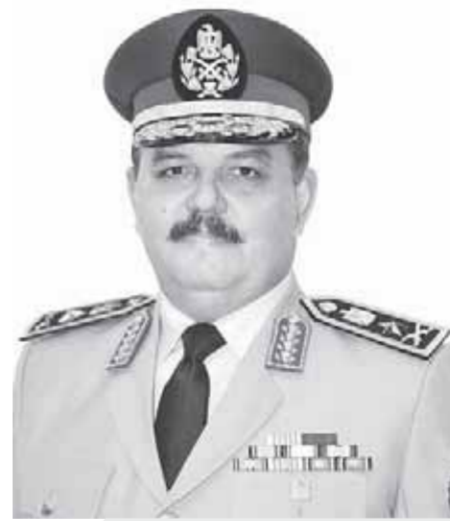
الفريق على فهمي قائد قوات الدفاع الجوي

وتم إنشاء هذه المواقع وتحسينها تمهيداً لإدخال الصواريخ المضادة للطائرات بها في ظروف بالغة الصعوبة، حيث كان الصراع بين الذراع الطولي لإسرائيل المتمثل في قواتها الجوية لمنع إنشاء هذه التحصينات وبين رجال الدفاع الجوي بالتعاون مع شركات الإنشاءات المدنية في ظل توفير الوقاية المباشرة من هذه المواقع