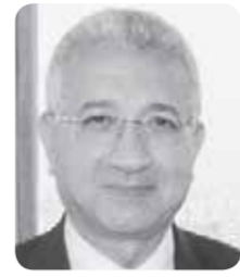
السفير دكتور محمد حجازي مساعد وزير الخارجية الأسبق