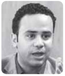
محمود بدر عضو مجلس النواب مؤسس حملة ترمذ