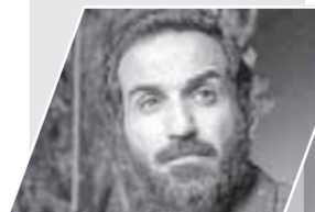
أعلن أحمد فهمي عودته مرة أخرى لصفحته الشخصية على موقع تبادل الفيديو والصور إنستجرام، وذلك بعد أن أغلقها منذ عدة أسابيع عندما اعتذر لجمهوره عن مسلسل رجال البيت.