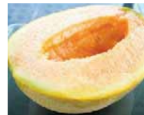
شمام ملك يوباري بسعر 10000 دولار

يعتبر فاكهة بطيخ «Den-suke»، من أغلى الفواكه في اليابان، وينتج منه ١٠٠٠٠ ثمرة بشكل سنوي، ويتميز لون قشرة البطيخ باللون الأسود، ويصل سعره إلى ٦٠٠٠ آلاف دولار.