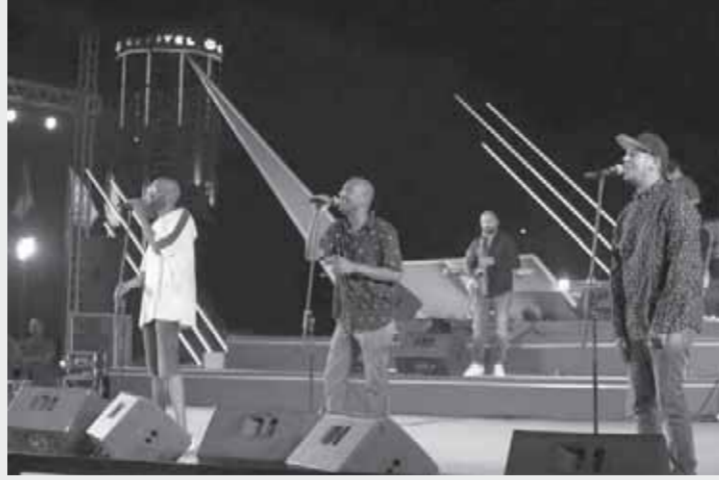
رئيس الأوبرا: الحفلات الصيفية تحتوى طاقات الشباب وتكسب التنوع الموسيقى والغنائى المصرى

المتميزة والطرب الأصيل والموسيقى الشرقية والغربية وحفلات كبار المطربين، وأشاد بالتزام الجمهور خاصة الشباب وسلامة الجمهور والفنانيين.