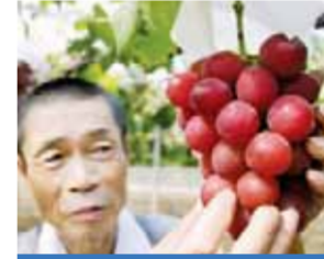
عنب روماني بسعر 1400 دولار

تزرع اليابان بطيخاً مربعاً في صناديق مربعة، والذي يشبه إلى حد ما أنواع البطيخ الأخرى، ومع ذلك، فإن شكله المربع يجعله موضع اهتمام وهو من أسباب وصول سعره إلى ٨٠٠ دولار.