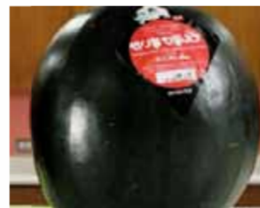
بطيخ «Densuke» بسعر 6 آلاف دولار

يعتبر فاكهة بطيخ «Den-suke»، من أغلى الفواكه في اليابان، وينتج منه ١٠٠٠٠ ثمرة بشكل سنوي، ويتميز لون قشرة البطيخ باللون الأسود، ويصل سعره إلى ٦٠٠٠ آلاف دولار.