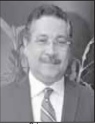
AIZ or M.C

أطلق بنك التعمير والإسكان حملته على جوائز حسابات التوفير كجزء من استراتيجية البنك لتقديم خدمات مصرفية تنافسية ومزايا ترضي القطع الأكبر من العملاء. تأتي هذه الحملة في إطار تشجيع العملاء الحاليين والجدد على استثمار مدخراتهم والتمتع بالمزايا العديدة والتسهيلات التي تقدمها حسابات التوفير المتنوعة بالبنك والتي تنافس في مزاياها أكبر البنوك المصرفية في مصر. تسري الجوائز المعلن عنها على مجموعة متميزة من حسابات التوفير التي صممت خصيصاً لتلائم احتياجات الشريحة الأكبر من العملاء بما يحقق أقصى درجات الرضا لعملائنا ولجذب أكبر قطاع ممكن من الجمهور والتوسع في تطبيق الشمول المالي. تشمل الحملة العملاء الحاليين والجدد من خلال سحب أسبوعي على بعض حسابات التوفير التي تصل رصيدها إلى 10000 جنيه ويعد فرص تساهي مضافات 50000 ج. وتشمل هذه الحسابات حساب ادخار مصرية يعد بنك التعمير والإسكان في مقدمة البنوك المصرية التي قدمت أوعية ادخارية خاصة بالمرأة تحت اسم «حساب ادخار مصرية».