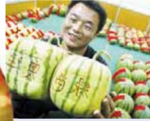
بطيخ مربع بسعر 800 دولار

تعتبر الفواكه من الأطعمة التي تحتوي على عناصر غذائية مهمة، يحتاجها جسم الإنسان ليشعر بالنشاط والحيوية، كما أنها من الأطعمة رخيصة الثمن، لكن مع تطور العصور ووسائل التكنولوجيا التي ساعدت في ظهور أنواع مختلفة من المحاصيل الزراعية، ظهرت أنواع من الفواكه غالية الثمن، والتي أشار إليها موقع «fruit-ukraine»، في تقرير منشور بعنوان أغلى الفواكه في العالم.