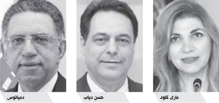
دميانوس كاتار، حسان دياب، ماري كلود. الأوضاع الاقتصادية والمعيشية والمالية. والسبت قدم 6 نواب استقالتهم من البرلمان اللبناني، عقب انفجار مرفأ بيروت، من بينهم 3 نواب من حزب الكتائب، فضلاً عن النائبة المستقلة يولا يعقوبيان، ومروان حمادة المقرب من جنبلاط، ونعمة أفرام. وأعلن النائب نعمه أفرام (مستقل) وميشال معوض رئيس حركة الاستقلال وعضو كتلة لبنان القوي (الكتلة النيابية للتيار الوطني الحر) وديما جمالي عضوة الكتلة النيابية لتيار المستقل، من جهة ثانية، قدم عضو مجلس بلدية بيروت

كلود، باستقالته، من الحكومة إلى رئيس الوزراء حسان دياب، لتلحق بوزيرة الإعلام منال عبدالصمد ووزير البيئة والتنمية الإدارية دميانوس قطار، لتصبح ثالث أعضاء الحكومة في قائمة الاستقالات منذ انفجار مرفأ بيروت، الذي خلف خسائر بشرية بالجملة ودماراً واسعاً في العاصمة اللبنانية. وقالت الوزيرة في خطابها: إنها قدمت التي تضرب العاصمة منذ يومين. كما تقدم النائب هنري الحلو، باستقالته من منصبه في البرلمان اللبناني، إلى الأمين العام لمجلس النواب عدنان ضاهر، ليكون بذلك عاشر نواب يقدم استقالته، في حين قدم عضو المجلس البلدي في بيروت استقالته. ويشغل الحلو منصبه نائباً عن دائرته بعبدا وعالية منذ إعلان 2003، وهو عضو في اللقاء الديمقراطي الذي يترأسه السياسي الدرزي وليد جنبلاط. وكان من أعضاء مجلس النواب اللبناني أعلنوا التنازل عن مناصبهم من البرلمان، يمثلون كتلتين نيابيتين مختلفة وأخرون مستقلون، وذلك على خلفية تداعيات الانفجار المدمر الذي تعرضت له العاصمة بيروت والتدهور الحاد في