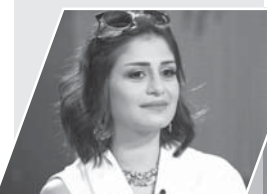
تنتظر عرض فيلم «زنزانة 7 يوم 16 سبتمبر الجاري» وبشاركها البطولة مجموعة من النجوم منهم أحمد زاهر وعبير صبري وإيهاب فهمي ومايا نصري ومدحت تيخة ومنة فضالي وأحمد النهامي وإخراج إبرام نشأت وتأليف حسام موسى وقد قامت الشركة المنتجة بطرح البرومو الدعائي له استعدادا لطرحه.