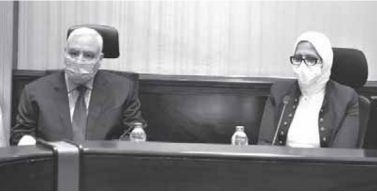
وزيرة الصحة مع رئيس الهيئة الوطنية للانتخابات