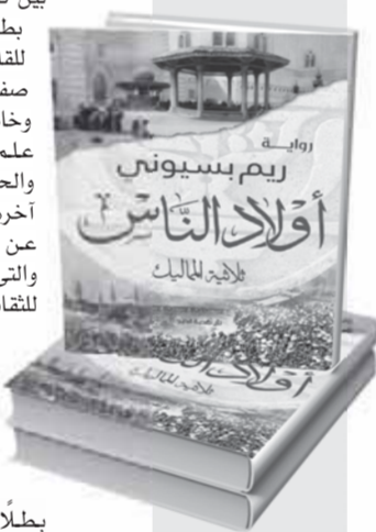
رواية ريم بسبوني «أولاد الناس»

وعن طريق تشييد العمائر والمساجد، كان بناء الرواية حتى أصبحت شاهداً على الأحداث التاريخية العظيمة والمؤلمة في بعض الأحيان، واستطاعت بسبوني أن تقدمها بوضوحاً تفسيرا لتصبح «بطلا من أبطال الرواية، من زخارفها وأبوياها وجدرتها، كذلك مكالمتها المفردة، جاء وصفها في مشهد تفصيلي حملت خلالها أحداث وعكست نوايا دقيقة داخل كل شخصية ونظرتها لهذه العمائر، وكان مسجد السلطان