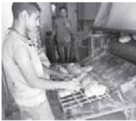
اقتصاد 7.5 مليار جنيه للهيئات السلعية والخدمية 06