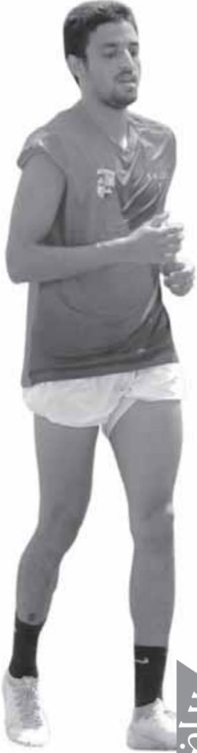
رياضة الفجبي الجديد 11