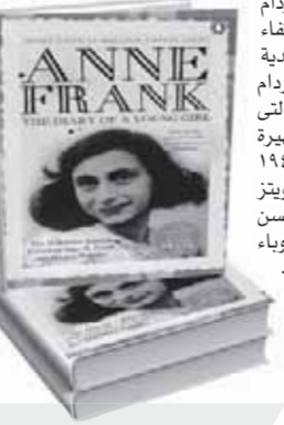
الكتاب «Anne Frank»