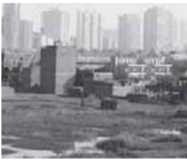
متابعات 6 خسائر للبناء على الأراضي الزراعية 05