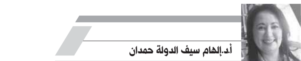
أ.د. إلهام سيف الدولة حمدان

كثفت صندوق مكافحة وعلاج الإدمان والتعاطى برئاسة نيفين القباج وزيرة التضامن ورئيس مجلس إدارة الصندوق حملات الكشف المبكر عن تعاطى المواد المخدرة بين سائقي حافلات المدارس من خلال مجموعات عمل مشتركة من الصندوق والإدارة