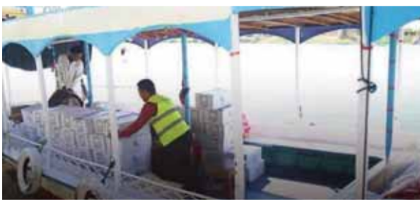
كتب - نشأت حمدي

جابت مؤسسات صناع الخير للتتمة وحياة كريمة وبنك القاهرة وسي إس آر إيجهت عدداً من قرى النوبة والقرى الأشد إحتياج بعدد من مراكز أسوان لتوزيع مساعدات غذائية وبطاطين الشتاء وحقائب الوقاية من الإصابة بفيروس كورونا بعد نجاح قافلتهم الطبية الموسعة وذلك كله ضمن قوافل مبادرة «حماية» لدعم المحافظات الحدودية والتي يتم تنظيمها تحت رعاية الدكتور نيفين القباج وزيرة التضامن الإجتماعي والسيد اللواء أشرف عطية محافظ أسوان.