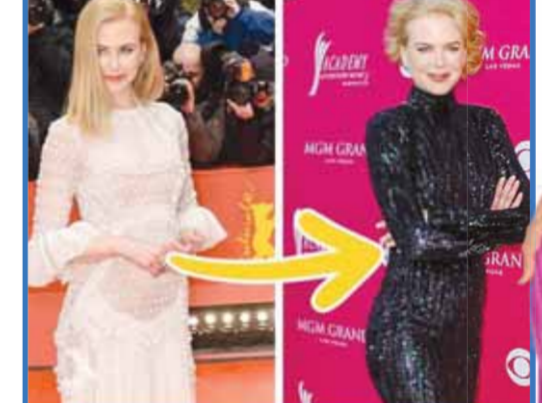
4 hard-boiled eggs

نيكول كيدمان بعد الولادة كان على نيكول أن تتبّع نظاماً غذائياً قاسياً لاستعادة رشاقتها مرة أخرى، وكان الريجيم يتكون من ١ بيضة مسلوقة على الإفطار، وأخرى على الغداء، و٢ على العشاء، ومثل هذه التعديلات غير صحية وغير متوازنة، إلا أن الممثلة خسرت أكثر مما توقعت.