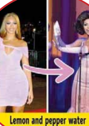
Lemon and pepper water

بيونسيه رفضت بيونسيه تناول الطعام القاسي من أجل خسارة ١٥ رطلاً إضافياً لدورها في Dreamgirls، ولعمدة أسبوعين، كانت تشرب الماء فقط مع عصير الليمون والخل والفاصل الحار، وأحياناً تضيف الخضراوات الطازجة، وكانت النتيجة مذهلة، لكن المغنية اعترفت بأنها لن تجرؤ على تجربة هذه الريجيم مرة أخرى.