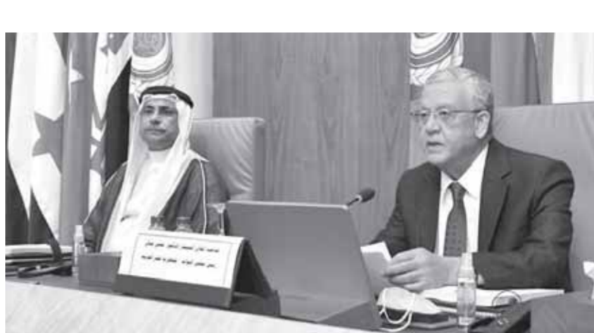
وجهه جبالى، الشكر لرئيس البرلمان العربي، عادل بن عبد الرحمن العسومي، لدعوته للمشاركة في افتتاح أعمال الجلسة العامة للبرلمان العربي، أمس بميدان تقديره للحديث أمام ممثلى البرلمانات العربية بوصفهم سدنة الدساتير، والتحديات التي تواجه أمتنا العربية، ثمناً لإنشاء

ثمن نطط البرلمان العربي الطموحة للتعاوى والاشتباك مع تحديات الأمة مصر ستظل داعمة ومساندة للبرلمان العربي لإحياء قيم التضامن المشترك