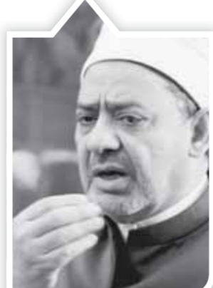
د. أحمد الطيب شيخ الأزهر الشريف

وأضاف الإمام الأكبر أن الدرس المستفاد من تلك الآية هو أن الثراء والرفاهية هما سبب الكبر، وتأثيرهما أسرع من غيرهما إلى الكبر والغرور، لتوافر أسبابه ودواعيه، وقد أمر الله نبيه بالتواضع، قال تعالى «واخفض جناحك لمن اتبعك من المؤمنين» وقوله «ولا تصعر خدك للناس ولا تمش في الأرض مرحاً إن الله لا يحب كل مختال فخور».