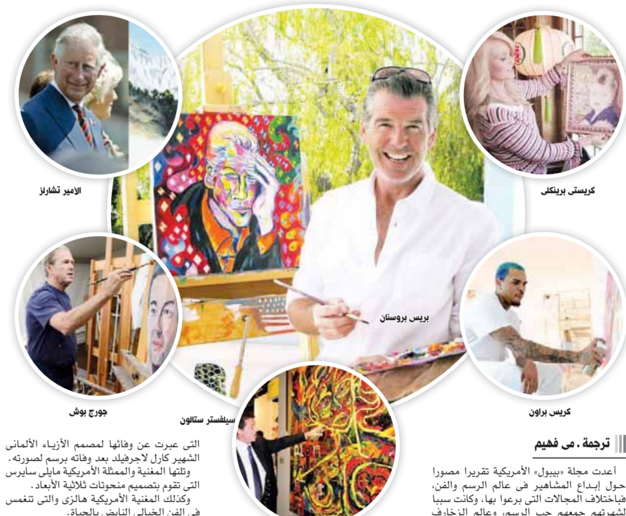
الامير تشارلز جورج بوش سيلفستر ستالون