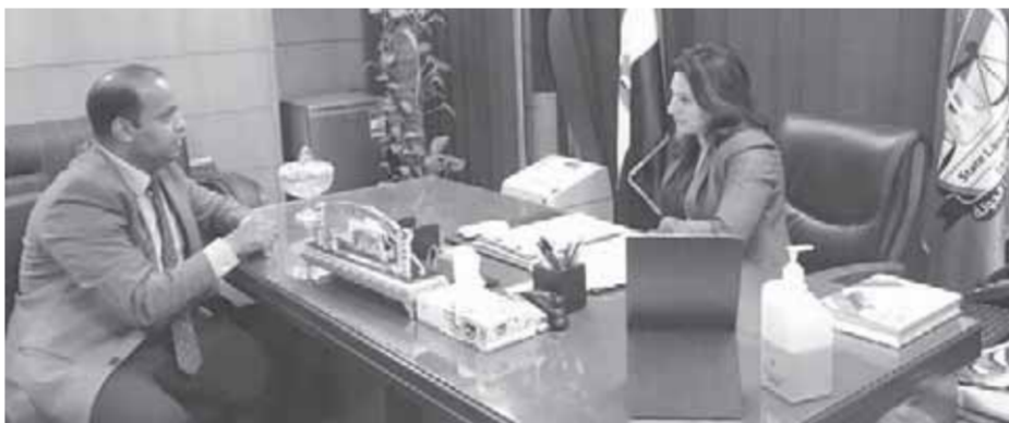
المستشارة في مروان مع محرر «روزاليوسف»

هذا المنصب يكمن دوره في التنسيق بين الإدارات المختلفة داخل الهيئة خاصة أن هذا المنصب مستحدث ولأول مرة يتولاها أحد العناصر النسائية في إطار تمكين العنصر النسائي داخل الهيئة حيث يختص هذا الموقع القضائي المستحدث بكل ما يخص الموظفين من ندب وترقيات وإعازتهم وقضايا التسويات الخاصة بهم في جميع فروع الهيئة على مستوى الجمهورية.