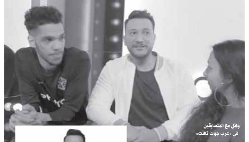
وائل مع المتسابقين فى «عرب جوت تالنت»

باسل الزارو: لم أعتزل الإعلام.. وصادقتى مع كارول سماعة سبب ظهورى فى كليب «Bon Voyage»