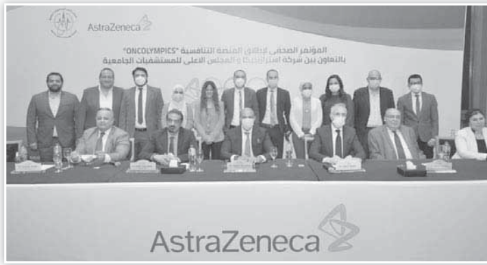
التعاون مع كل المشاركين من الجامعات المشاركة.