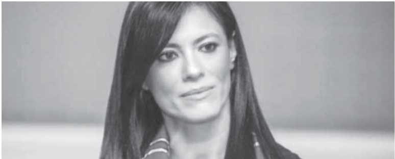
كتب - هشام يونس

أعلنت الدكتورة رانيا المشاط، وزيرة التعاون الدولى، أنه تم تنفيذ ٣٥ برنامجاً تدريبياً مع الصين شارك عدد من الكوادر الحكومية، منذ بداية العام الجارى، فى قطاعات النقل والنقل البحرى والصحة والتعليم وعلوم الفضاء والبيئة والصناعة والتضامن والزراعة والكهرباء، وذلك فى إطار الشراكات الدولية التي تعقدتها الوزارة مع شركاء التنمية، وذلك بهدف دعم جهود الدولة نحو تعزيز الاستثمار فى رأس المال البشرى وتدريب الكوادر الحكومية.