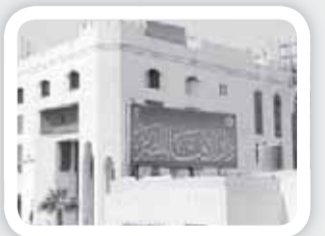
د. محمد مختار جمعة