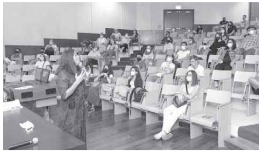
كتبت - شيمة عدلى

الجامعة الأمريكية تبدأ الدراسة وجهاً لوجه بإجراءات مشددة اليوم