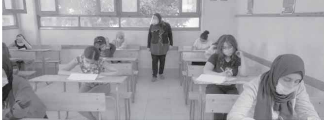
كتبت - مينا سعد

18 ألف طالب يؤدون امتحان الدور الثاني بالشعبتين الأدبي والعلمي