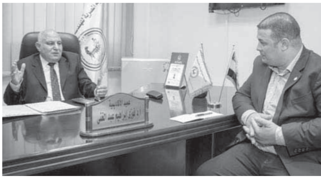
محرر «روزاليوسف» أثناء إجراء الحوار

التواصل مع الجهات التعليمية والبحثية الأخرى؟ هناك العديد من بروتوكولات التعاون المبرمة مع كبرى الجامعات المحلية والدولية وذلك بهدف تبادل الخبرات والمعرفة بما يحقق أقصى استفادة للطلاب «سواء طلاب الأكاديمية أو طلاب الجامعات الأخرى التى يتم التعاون معها»، ومن هذه الجهات التعليمية (جامعة أمينى بالهند، الجامعة المصرية الصينية، كلية الهندسة بجامعة عين شمس والقاهرة وحلوان، مدينة زويل للعلوم والتكنولوجيا، جامعة بدر، الأكاديمية العربية للعلوم والتكنولوجيا والنقل البحرى).