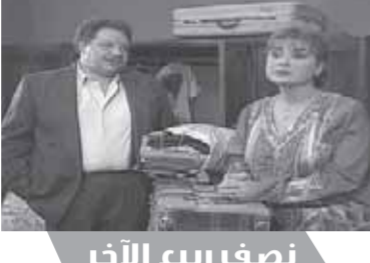
نصف ربيع الآخر