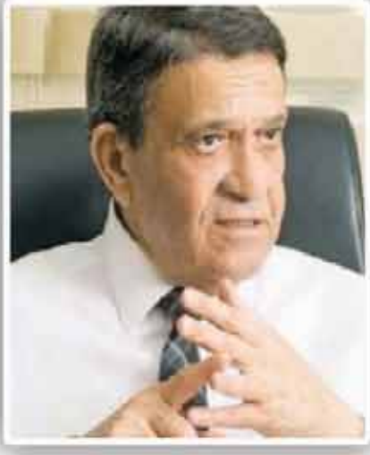
لواء. أحمد زكي عابدين