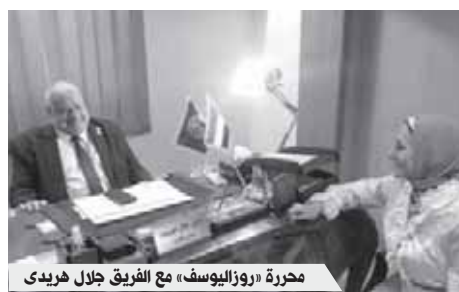
مؤتمر روزاليوسف، مع الفريق جلال هريدي

كيف ترى التغييرات التي طرأت على الحياة السياسية من تأهيل الشباب وتمنح فرص للأحزاب؟ - لولا إرادة وإيمان الرئيس السيسي بالشباب ما وصلنا إلى كل هذه الإنجازات، فالرئيس وعد الشعب المصري منذ توليه المسؤولية بأن يكون داعماً للشباب، ونجح في تحقيق ما تجاوز طموحا وخيالنا، فلم يكف بإعداد الشباب ليكونوا كوادر مستقبلية، بل استعان بهم ليكونوا جزءاً من الحاضر