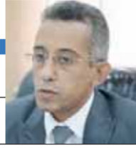
العودة إلى المستقبل م. زياد عبد التواب

ورق الكوتشينة والتاروت ورش الملح لطرد الجن وغيرها الكثير من الأمور الغريبة تشغل حيزاً من عقل ووجدان الناس