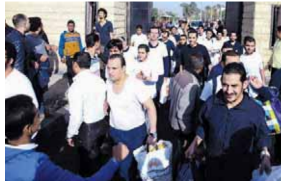
تحديد مستحقى الإفراج بالعفو عن باقى مدة العقوبة.. حيث انتهت أعمال اللجان إلى إنطباق القرار على (2337) نزيلا ممن يستحقون الإفراج عنهم بالعفو. يأتي ذلك في إطار حرص وزارة الداخلية على تطبيق السياسة العقابية بمفهومها الحديث، وتوفير أوجه الرعاية المختلفة للنزلاء، وتفعيل الدور التنفذي لأساليب المناسبات، فقد عقد قطاع الحماية المجتمعية لجانا لفحص ملفات النزلاء على مستوى الجمهورية،

بمناسبة الاحتفال بعيد الشرطة وذكرى مرور 70 عاما على ملحمة البطولة الخالدة لمعركة الإسمايلية.. وتنفيذا لقرار رئيس الجمهورية الصادر بشأن الإفراج بالعفو عن باقى مدة العقوبة بالنسبة لبعض المحكوم عليهم الذين استوفوا شروط العفو في تلك المناسبة، فقد عقد قطاع الحماية المجتمعية لجانا لفحص ملفات النزلاء على مستوى الجمهورية،