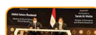
مذكرة تفاهم مع شركة ايناب سيبتترول تشيلي في مجال تأهيل وتطوير قدرات الكوادر الشابة.