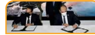
مذكرة تفاهم مع شركة ايناب سيبتترول تشيلي في مجال تأهيل وتطوير قدرات الكوادر الشابة.