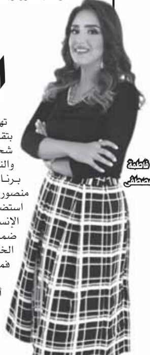
من برنامج «السفيرة عزيزة»

وأضاف، أنه وارد حدوث مشاكل أمام الأبناء نتيجة ضغوطات العمل والبيت، لكن الأهم الاعتذار. برنامج «8 الصبح»، على قناة DMC، استضاف وأفت شحاعة أستاذ