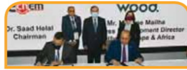
توقيع شركة البحر الأحمر للبتروكيمياويات اتفاقية الترخيص الخاصة بوحدة البولي إيثيلين مع شركة Univation.