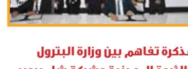
مذكرة تفاهم مع شركة ايناب سيبتترول تشيلي في مجال تأهيل وتطوير قدرات الكوادر الشابة.