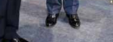
مذكرة تفاهم مع شركة ايناب سيبتترول تشيلي في مجال تأهيل وتطوير قدرات الكوادر الشابة.