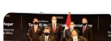
مذكرة تفاهم بين وزارة البترول والثروة المعدنية وشركة يوكوجاوا في مجال تأهيل وتطوير قدرات الكوادر الشابة بقطاع البترول.