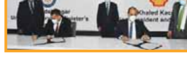
مذكرة تفاهم مع شركة ايناب سيبتترول تشيلي في مجال تأهيل وتطوير قدرات الكوادر الشابة.