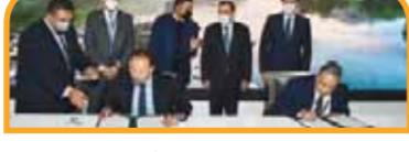
مذكرة تفاهم بين الهيئة المصرية العامة للبترول schneider Electric / Egypt / للتعاون لتنفيذ مشروع مركز القيادة الاستراتيجي لقطاع البترول في إطار رؤية وخطة وزارة البترول والثروة المعدنية للتحول الرقمي.