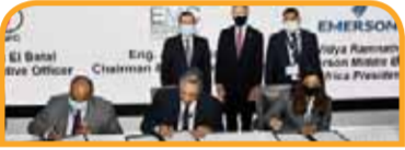
اتفاقية بين وزارة البترول والثروة المعدنية وشركة أباتشي الأمريكية لتأهيل القيادات