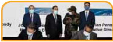
مذكرة تفاهم بين وزارة البترول والثروة المعدنية وشركة بي بي في مجال تأهيل وتطوير قدرات الكوادر الشابة بقطاع البترول