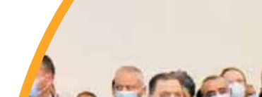
توقيع مذكرة تفاهم بين الهيئة العامة للبترول والهيئة العربية للتصنيع لتصنيع وصيانة التوربينات.