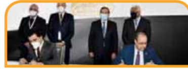
توقيع شركة البحر الأحمر اتفاقية الترخيص الخاصة بوحدة الهكسين والبيوتين مع شركة أكسس