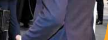
مذكرة تفاهم مع شركة ايناب سيبتترول تشيلي في مجال تأهيل وتطوير قدرات الكوادر الشابة.