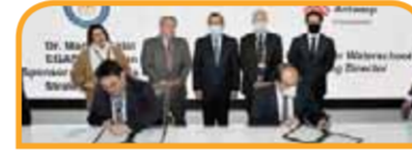
مذكرة تفاهم بين PAI (port of Antwerp Int) ووزارة البترول والثروة المعدنية لتنمية الموانئ ودعم أعمال تطويرها -استكشاف الإمكانات ومتابعة المشاريع في الموانئ المصرية والسوق البحرية، باستخدام خبرة أنتويرب في تعزيز الموانئ وإدارتها وتشغيلها.