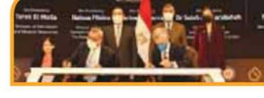
مذكرة تفاهم بين شركتي التعاون للبترول وشيخرون مصر / للتعاون في مجال توفير الزيوت، وأنشطة محطات الوقود وتجارة الزيوت والمنتجات الكيماوية.