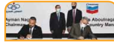
مذكرة تفاهم للتعاون في مجال توفير الزيوت وأنشطة محطات الوقود.