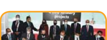
اتفاقية بين وزارة البترول وميناء انتويرب.