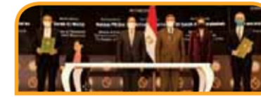
اتفاق بين وزارة البترول والثروة المعدنية وأباتشي الأمريكية لتطوير وتحديث الشركات المشتركة.