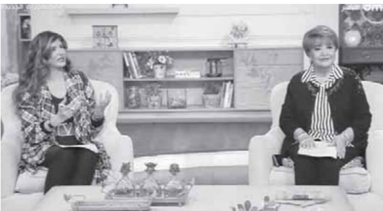
من برنامج «السفيرة عزيزة»

الإدارة والتنمية البشرية، والذي أكد ضرورة زرع القيم الإيجابية وروح التفاؤل والثقة بالنفس لدى الطفل، لذلك لا بد يكون لدى الأم إصرار وعزيمة تزرعها داخل الطفل، ولابد الشخص يكون لديه عزيمة وإيمان.