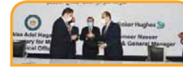
توقيع مذكرة تفاهم بين الهيئة العامة للبترول والهيئة العربية للتصنيع لتصنيع وصيانة التوربينات.