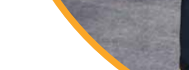
مذكرة تفاهم مع شركة ايناب سيبتترول تشيلي في مجال تأهيل وتطوير قدرات الكوادر الشابة.