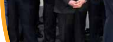
مذكرة تفاهم مع شركة ايناب سيبتترول تشيلي في مجال تأهيل وتطوير قدرات الكوادر الشابة.