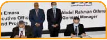
مذكرة تفاهم مع شركة بيكرهوز في مجال تأهيل وتطوير قدرات الكوادر الشابة بقطاع البترول