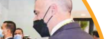
مذكرة تفاهم مع شركة هالبرتون في مجال تأهيل وتطوير قدرات الكوادر الشابة بقطاع البترول.