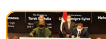
اتفاق القابضة للبتروكيمياويات مع ابني الايطالية.