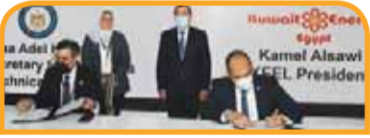
مذكرة تفاهم مع شركة هالبرتون في مجال تأهيل وتطوير قدرات الكوادر الشابة بقطاع البترول.