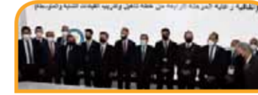
توقيع اتفاقية بين سيدبك وبنجيريا للمشاركة في إقامة مجمع البتروكيمياويات بنجيريا.