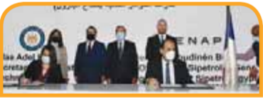
مذكرة تفاهم مع شركة كويت انرجي في مجال تأهيل وتطوير قدرات الكوادر الشابة بقطاع البترول.