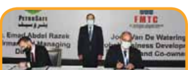
مذكرة تفاهم لشركة بتروسيف مع شركة Fmtc.