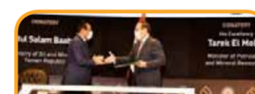
مذكرة تفاهم مع شركة ايناب سيبتترول تشيلي في مجال تأهيل وتطوير قدرات الكوادر الشابة.