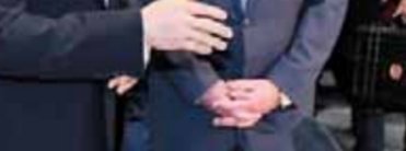
مذكرة تفاهم مع شركة ايناب سيبتترول تشيلي في مجال تأهيل وتطوير قدرات الكوادر الشابة.