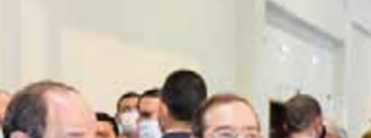
مذكرة تفاهم مع شركة ايناب سيبتترول تشيلي في مجال تأهيل وتطوير قدرات الكوادر الشابة.