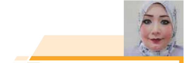
ليلى طاهر تكتب