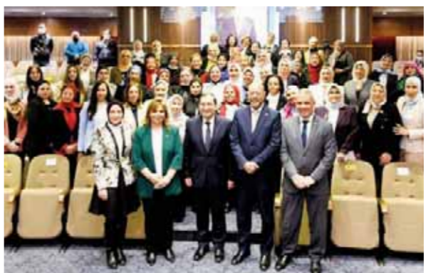
شارك المهندس طارق الملا وزير البترول والثروة المعدنية، أمينة المرأة بالنقابة العامة للعاملين بالبترول، احتفالها بيوم المرأة المصرية، الذي أقيم بمقر شركة إنيو بحضور عدد من قيادات الوزارة.

وأوضح الوزير أن مثل تلك اللقاءات تعد فرصة جيدة لزيادة الوعي بوضع صناعة البترول والغاز والتحديات التي تواجهها وأهمية مساهمة النقابات في دعم العاملين وزيادة الوعي لديهم