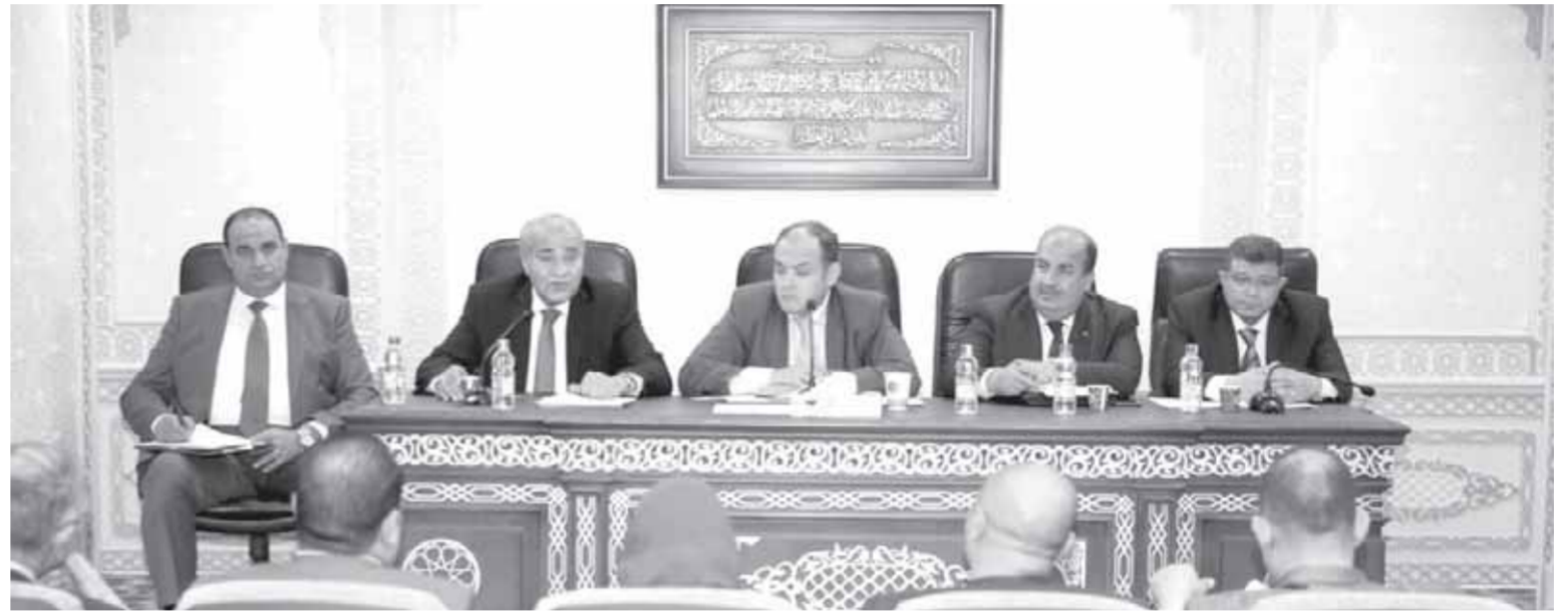
كتب: فريدة محمد ونشأت حمدي وحسن عبدالظاهر

ننتظر تحركًا حكوميًا برلمانيًا لتطبيق الدعم النقدي المشروط على منظومة الخبز