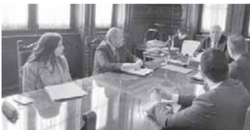
وزير الزراعة يتابع الجدول الزمني لافتتاح مصنع السكر بمحافظة المنيا

وكان متوسط الأنشطة الأعلى استخداماً يومياً على النحو التالي: ٣.٥ مليون ساعة يومياً مقاطع فيديو ترفيهية قصيرة منشورة بزيادة ١٥٨% و١٣١ مليون عملية بحث فى الخرائط بزيادة ١١١% و١٢.٩ مليون ساعة مشاهدة محتوى ترفيهي بزيادة ٧٦% و١٨١ مليون زيارة تسوق إلكتروني بزيادة ٤٧%.