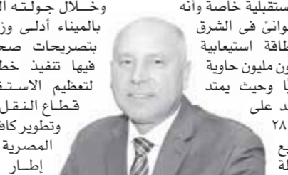
وزير النقل يتابع سير العمليات التشغيلية فى «ميناء حمد»

فى ختام زيارته للمصامصة القطرية الدوحة كلبية للدعوة الموجبة من جاسم بن سيف السليطى وزير المواصلات القطرى قام الفريق مهندس كامل الوزير - وزير النقل برافقه السفير عمرو الشريينى سفير مصر فى الدوحة بزيارة لميناء حمد واطلع خلالها على سير العمليات التشغيلية فى مرافق الميناء بالإضافة الى القيام بجولة فى ميناء ومخازن مشروع الأمن الغذائى ومركز زوار الميناء