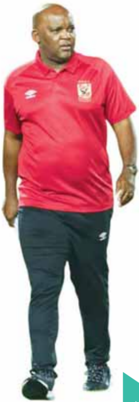
الصعود والإلى «الرجاء» الأخير» لموسيماني