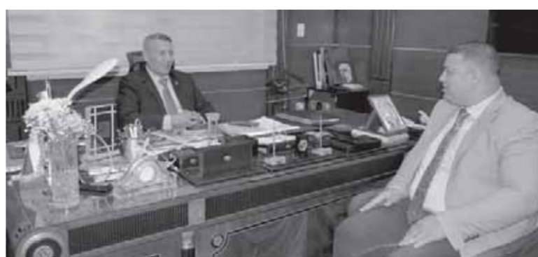
محرر روزاليوسف مع اللواء ماجد السيرتي

والحكومية والثقافية من (جامعات - مدارس - معاهد ووزارات)