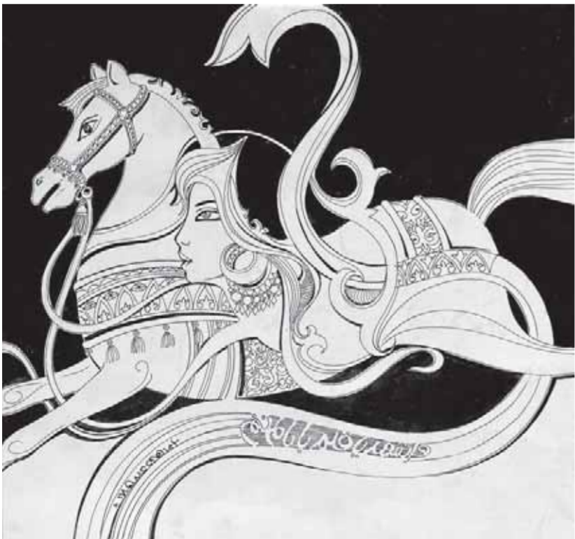
كتبتها - ثناء السيد

يقولون في حياتنا أيام علينا حالات أيام تمر بنا صعبة وأيام محبات وما صدقوا فالزمن يوم محبة وأيام عسيرات محن الزمن كثيرة وسروره يأتيك بالفلتات أى شيء يكون أعجب لو فكرت في تصريف الزمان محدثات السرور توزن وزنا والصعوبات تكال بالأحزان