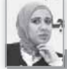
كتبتها - أسماء عبد الخالق

عليها الصبر والتغير والتطور لا استسلام. أما الألف: فالفق قويه متابرة، لا تحنى أبدأ، ألف صلدة شامخة رُغم هبوب الرياح العاصفة هي ثابتة لا تطأطن أبداً. والقاف: هي قافلة وحدها، تكفى نفسها وذويها، قمر ينير ظلمات الكل حولها، لا تطلب شيئاً سوى التامل والصبر، وكلمات الإطراء و التشجيع لتكمل المسير. أنشى يانعة، لن تقف حياتها عند كلمة، ستلقى عن كاهلها ماض مؤذ وستبدأ في رحاب الله ويحضن أطفالها كل ما هو جميل مختلف مميز، وستجو.