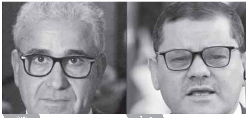
باشاغا (يسار) والدبيبة (يمين)

كان «سلميا»، مشيراً إلى أن تواجد المجموعات المسلحة في عدد من المناطق الليبية يعد «مشكلة أمنية مستمرة». وذكر المحجوب: «كان دخول باشاغا بشكل سلمي، لكن بعد الهجوم عليه، قرر الانسحاب حفاظاً على الأرواح». وبالتالي، لم تكن هناك أية مواجهة أو معركة». وأضاف: تواجد المجموعات المسلحة مشكلة أمنية مستمرة.. المشكلة أن الحكومات المتعاقبة قامت بزيادة قدرات هذه المجموعات المسلحة المتفولة داخل العاصمة وأصبحت عندها مناطق نفوذ». وتابع: «نحن مستمرين في بناء القوات المسلحة والجيش يدرك خطورة المرحلة، ولهذا تفادي التدخل المباشر في العاصمة من أجل مصلحة ليبيا العليا ومصصلحة الليبيين». في المقابل، توعد رئيس حكومة الوحدة الوطنية الليبية عبدالحميد الدبيبة، بالضرب بيد من حديد.. كل من سؤل له نفسه الممس بأمن المواطنين وسلامتهم، وذلك في أول تعليق على عملية دخول رئيس الحكومة المكلف من البرلمان فتحى باشاغا إلى العاصمة طرابلس، التي تسببت في اندلاع اشتباكات مسلحة، دفعت إلى مغادرتها. ويعد انتهاء الاشتباكات، ظهر رئيس الحكومة عبدالحميد الدبيبة وهو يقوم بجولة ميدانية في المنطقة التي شهدت المعارك وشوارع العاصمة طرابلس.