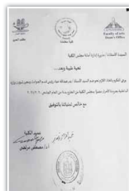
جواب بهنئة زيرة وانتقال صفة محرر الدخيلة للحصول على الدكتوراه من جامعة عين شمس