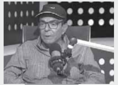
عن حلقة سمير صبرى

عبرت الإعلامية إنجي علي، عن سعادتها برود الفعل التي تلقته حول الحلقات التي قدمتها من برنامج نجوم رمضان أقرب لك، الفترة الماضية، منها حلقة الفنان أكرم حسني، لافتة إلى أن معظم نجوم دراما رمضان كانوا ضيوفًا في برنامجها. وأضافت «علي» لـ«روزاليوسف»، أن الفنان محمد حاتم سيكون ضيف برنامجها «أسرار النجوم» غدا الخميس، للحدث عن دوره في مسلسل «بطول الروح».