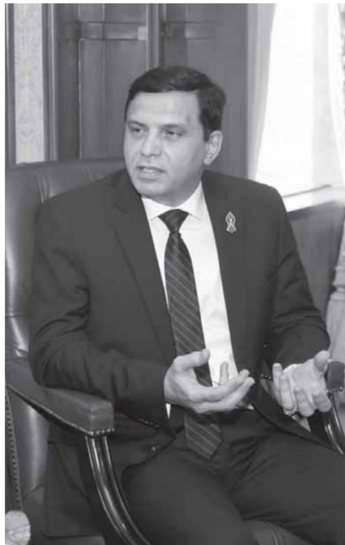
الحوار الوطني خطوة مهمة نحو الجمهورية الجديدة

– فور تلقينا الدعوة للمشاركة في الحوار الوطني من جانب الأكاديمية الوطنية للتدريب، قمنا بتوجيه كواد الحزب المتخصصين في كل المجالات، من أجل إعداد الرؤية المطلوبة لمصلحة الوطن والمواطن، وتم وضع رؤية خاصة بالحزب على كل المحاور والملفات الخاصة بالحوار من أجل فتح مسارات للتفاعل المجتمعي حول كل القضايا السياسية والاقتصادية والاجتماعية التي تستهدف بناء الجمهورية الجديدة بمشاركة جميع فئات المجتمع، وهذه الرؤية سيتم طرحها على مائدة الحوار الوطني كما يقوم الحزب بعقد سلسلة من الاجتماعات المختلفة التي سيتم طرحها في الحوار الوطني، والذي سيجمع كافة أطراف الشعب للإرتقاء بالدولة المصرية وصولا إلى الجمهورية الجديدة، مؤكدا أن خطوات الأكاديمية الوطنية للتدريب وإعلانها دعوة جميع ممثلي المجتمع المصري بكافة فئاته ومؤسساته بأكبر عدد ممكن لضمان تمثيل جميع الفئات في الحوار المجتمعي، وكذا تحقيق الزخم الحقيقي والمصداقية وتدشين مرحلة جديدة في المسار السياسي نحو الجمهورية الجديدة، التي تتسع للجميع وتستمع لجميع الآراء بما