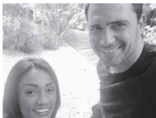
من ظفر العابدين من مسلسل «حلاوة الدنيا»

وعلى جانب آخر، عبرت عن سعادتها بإعادة عرض مسلسلى «ورا كل باب» والذي شاركت خلاله في حلقة «ورقة منغلط» مع الفنان فتحي عبدالوهاب، ومسلسل «حلاوة الدنيا» والذي شاركت فيه مع الفنانة هند صبرى وظافر العابدين. وأكدت أنها تنوى العودة للتمثيل لكنها تنتظر عملاً مناسباً ودوراً مختلفاً لتقديمه للجمهور.