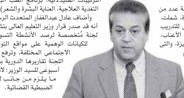
كتب: شيماء على

هل يعلم القارئ العزيز أن اقتصاد العالم خلال القرنين الأخيرين سيطرت عليه ثلاث عائلات فقط بشكل مباشر، وهى عائلات روتشيلد، روكفلر، ومورجان وأن هذه العائلات الثلاث استأثرت وحدها بحوالى 90% من أسهم البنوك المركزية فى أغنى دول العالم فى القارة الأوروبية والولايات المتحدة الأمريكية وهى صاحبة الحق فى طباعة الأوراق النقدية فى هذه الدول، كما أنهم سيطروا على معظم أسهم البنك الاحتياطى الفيدرالى الأمريكى وعلى صناعة النفط وصناعة الأدوية وصناعة السجائر ومعظم البنوك فى وول ستريت وأهم عائلة من هذه العائلات هى عائلة روتشيلد وهى أقدم وأغنى العائلات اليهودية فى العالم حيث تمتلك 80% من ثروات العالم، وهى المسؤولة عن الأزمات وأحداث المشاكل والأزمات الاقتصادية وكذلك الحركات السياسية، والثورات عبر العالم، بالتعاون مع روكفلر ومورجان هذا فضلاً عن أن عائلة روتشيلد تهيمن على معظم البنوك المركزية بالعالم، وتمتد هذه العائلة أكبر راع وداعم لحركة الماسونية العالمية وهى الحركة التى توقد نار