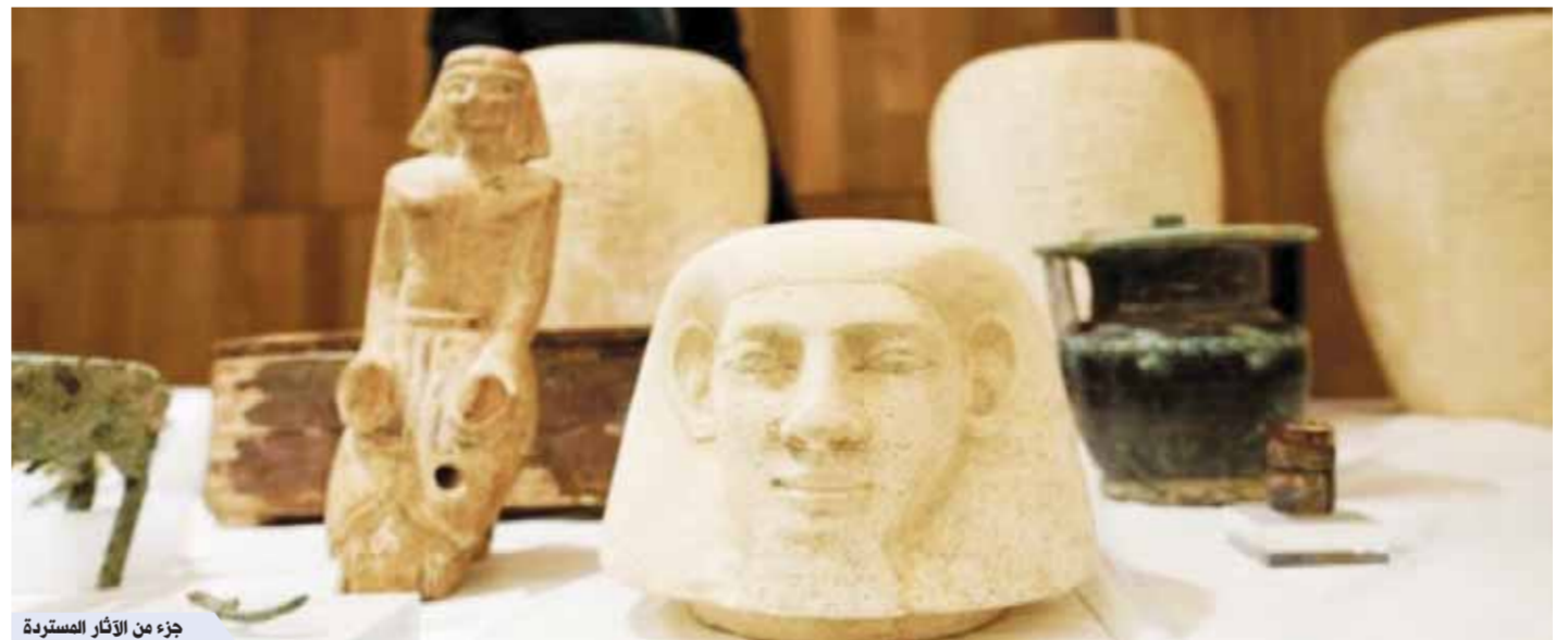
جزء من الآثار المستردة