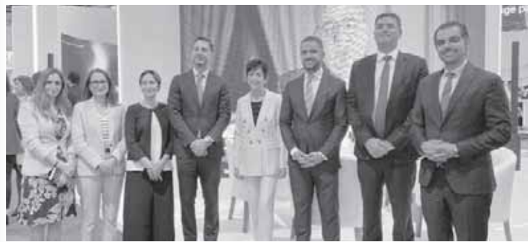
خلال مشاركتها فى أول معرض ومؤتمر صحى أفريقياى يقام فى القاهرة، ساهمت نوفارتس وساندوز مصر التى تشمل قطاع الأدوية الجينية والعمليات الحيوية فى نوفارتس، فى نجاح المعرض والمؤتمر الطبي الأفريقى الأول